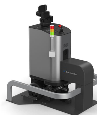
巡回点検をDX化、 予兆保全